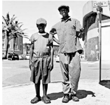
Sander Troelstra, Straatkinderen in Durban, Zuid-Afrika.

Grote publiekstrekker is de presentatie van het werk van drie kunstenaars in de Nederlands-Vlaamse portretfotografie: Kees Breukel, Joost